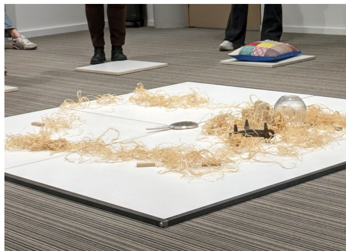
Figuur 3. Materialen op Het Vlak tijdens een dialoog over 'vaccinaties'.

“Eerst snapte ik echt niet waarom iemand een bepaald object koos, maar na de uitleg was die keuze eigenlijk heel logisch. Iets waar ik zelf niet aan had gedacht, maar heel erg klopte in het kader van dit onderwerp.” – student over Het Vlak