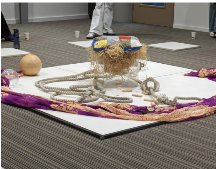
Figuur 4. Constellatie van objecten op Het Vlak tijdens een dialoog over 'burn-out'.

Het Vlak is ontwikkeld om een andere manier van spreken met elkaar te kunnen oefenen. In stilte luisteren en observeren is in deze vorm minstens even belangrijk als het hardop spreken. De vorm nodigt uit om, terwijl een ander spreekt, in stilte met het denken en handelen van de ander mee te bewegen. De manier waarop objecten, personen en gedachten met elkaar in verhouding worden gebracht creëert voor de deelnemers een ruimte waarbinnen bestaande verhoudingen en patronen opnieuw of anders gezien en doorvoeld kunnen worden. In deze vorm bouw je letterlijk samen een gesprek en ervaar je hoe denken altijd een samen denken is, zonder dat je het eens hoeft te worden, elkaar hoeft te overtuigen of een oplossing hoeft te vinden. Dit is een radicaal andere manier van met elkaar spreken dan wat we op de universiteit gewend zijn. Het kost tijd om je deze vorm van spreken eigen te maken. Daarom moet het Vlak niet als een op zichzelf staande activiteit benaderd worden, maar als een vorm die bijdraagt aan het ontwikkelen van een open gesprekscultuur in een cursus of programma. Hiervoor is het aan te raden om studenten vaker met deze en/of andere vormen van alternatieve gespreksvoering in aanraking te laten komen. In bijlage 2 vind je concrete leeractiviteiten waarmee de ervaring van Het Vlak nog verder verdiept kan worden.