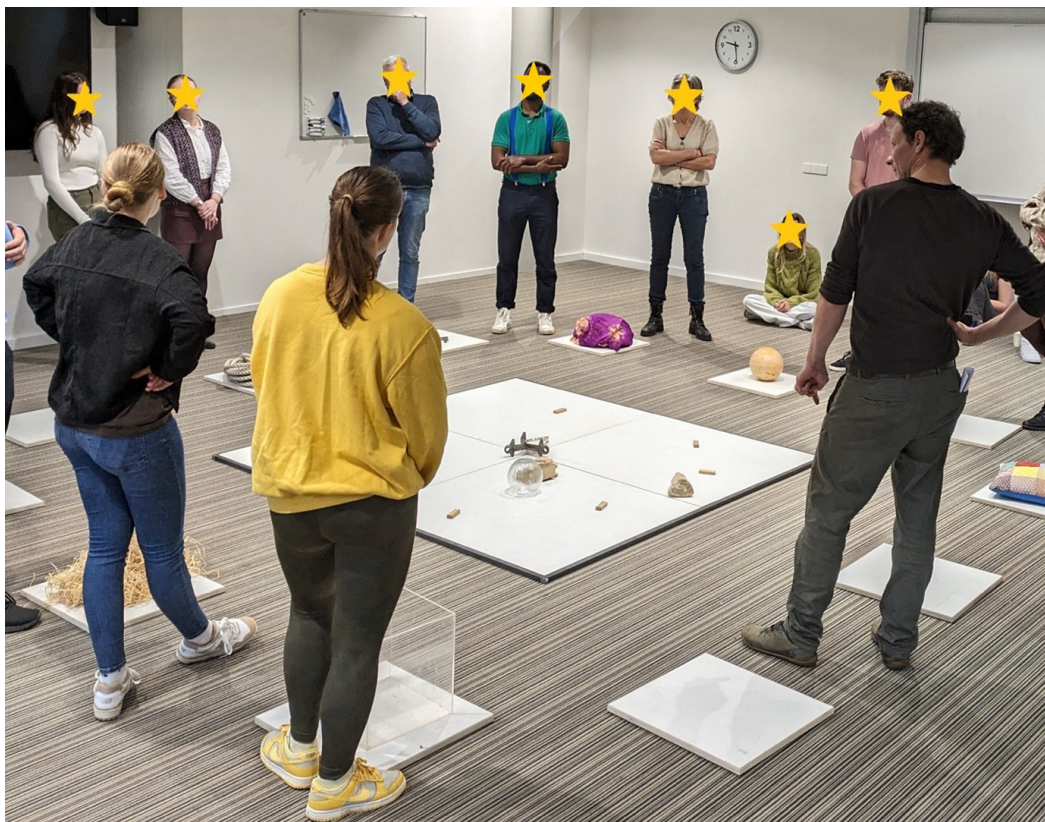
Figuur 2. Het Vlak in werking bij de interdisciplinaire opleiding Zorg, Gezondheid en Samenleving.

“Het gesprek verloopt door de vorm heel rustig. Iedereen komt aan de beurt en luistert naar elkaar. Maar terwijl je naar de ander luistert ben je heel erg aan het denken ‘maar wat vind ik hier eigenlijk van?’” – docent over Het Vlak